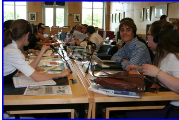
Young people from CRAE presenting their findings to the UN Committee

Самый важный комитет ООН, касающийся детей – Комитет по правам ребенка. Он следит за соблюдением и защитой прав ребенка. Каждые 5 лет Комитет ООН по правам ребенка исследует, насколько хорошо Ваше правительство реализовало на практике положения Конвенции о Правах Ребенка. Комитет встречается 3 раза в год в Женеве (Швейцария).