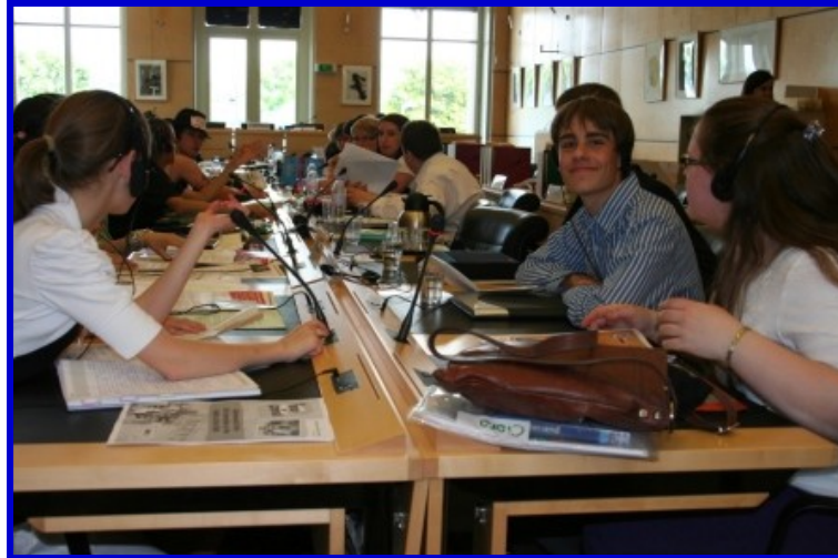
Noored CRAE-st esitlemas on õigusi Laste Õiguste alases komitees

Lastele on kõige tähtsam ÜRO komiteedest laste õiguste komitee. Antud komitee vaatleb, kui hästi või halvasti edendatakse ning kaitstakse lapse õigusi.